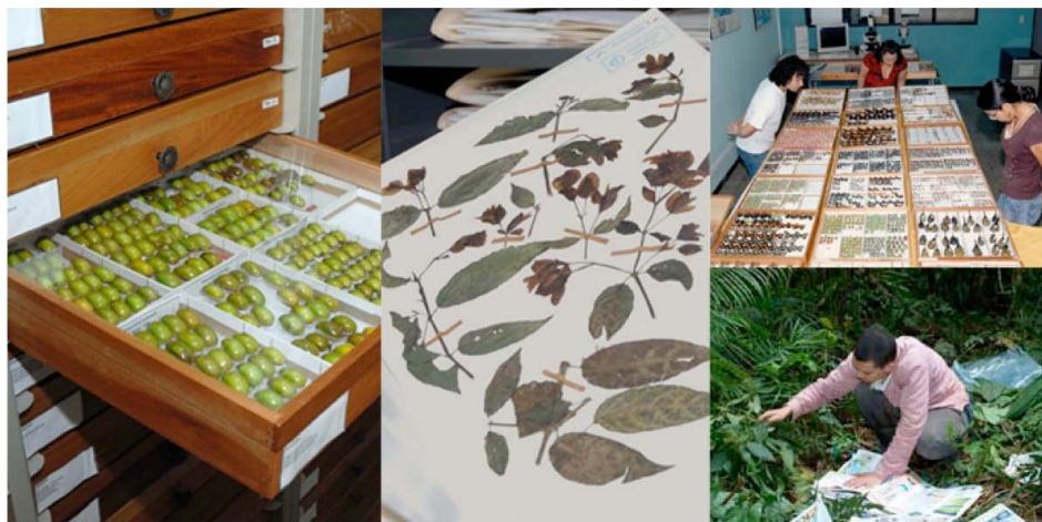
Figura 2. La colección de especímenes biológicos constituyó una “biblioteca” de buena parte de la biodiversidad de las áreas silvestres protegidas del país, cumpliendo funciones científicas y educativas para miles de personas. Fue donada al Museo Nacional, UCR y UNA, con toda la información en la base de datos Atta.

Figure 2. The collection of biological specimens constituted a “library” of much of the biodiversity of the country’s protected wild areas, fulfilling scientific and educational functions for thousands of people. It was donated to the National Museum, UCR and UNA, with all the information in the Atta database.