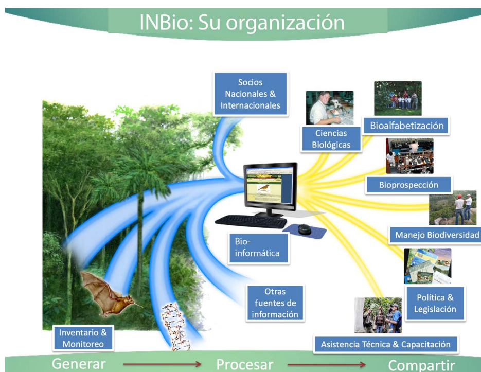
Figura 1. De manera figurativa, la misión y visión del INBio fue generar información sobre la biodiversidad de un bosque, procesarla y ponerla en formatos adecuados para los intereses de diversos tipos de usuarios, para así promover una mayor conciencia de su valor, promoviendo su conservación.

El INBio se gestó como una institución multidisciplinaria, organizada para el trabajo en equipo, siendo la naturaleza de la tarea a resolver lo que determinaba la composición del grupo humano encargado. Se definieron tres grandes áreas de trabajo, todas interrelacionadas: la generación de información, el ordenamiento de la información (propia y proveniente de otras fuentes) y la transferencia de los datos, en formatos adecuados, para diferentes usos y usuarios ( Figura 1 ).