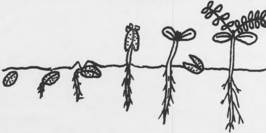
Figura 2: Proceso de germinación para la especie G. sanctum (Guayacán real).

En el caso donde se aplicó la escarificación se obtuvo, una muy buena germinación, siendo siempre el tratamiento plantado en tierra el que mostró superioridad en la germinación obteniendo un 42%, mientras que el mismo tratamiento en arena alcanzó un 36%. Estos datos son superiores al dato de germinación obtenido para el testigo y el reportado por la literatura 4 . El tratamiento testigo presentó un porcentaje de germinación del 29,6%, dato que es bastante consistente con el dato obtenido años atrás por el PRS.